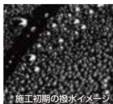
施工初期の撥水イメージ

光沢、艶、膜厚感、持続性、汚れを防ぐ効果…。その全てにおいてプレミアムクオリティ。