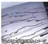
シヤリング時の撥水イメージ

高硬度な被覆性能を維持しながらも高い弾性のあるしなやかな膜を併せ持つ3Dガラス層格中へ、膜基を高濃度に分子レベルで結合させた次世代ハイブリッドガラス系被覆膜です。